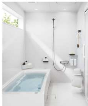
1616 (Jタイプ) ※標準タイプは「Pタイプ」を標準採用 (FRP浴槽・ホーロークリーン浴室パネル)。上位の「Jタイプ」 (アクリル人造大理石浴槽) もオプション対応。

※ リラクシアは「Pタイプ」を標準採用 (FRP浴槽・ホーロークリーン浴室パネル)。上位の「Jタイプ」 (アクリル人造大理石浴槽) もオプション対応。