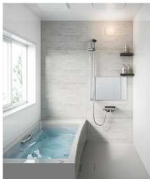
1616 (標準タイプ) ※標準タイプは「Pタイプ」を標準採用 (FRP浴槽・ホーロークリーン浴室パネル)。上位の「Jタイプ」 (アクリル人造大理石浴槽) もオプション対応。